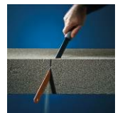
Leicht zu bearbeiten